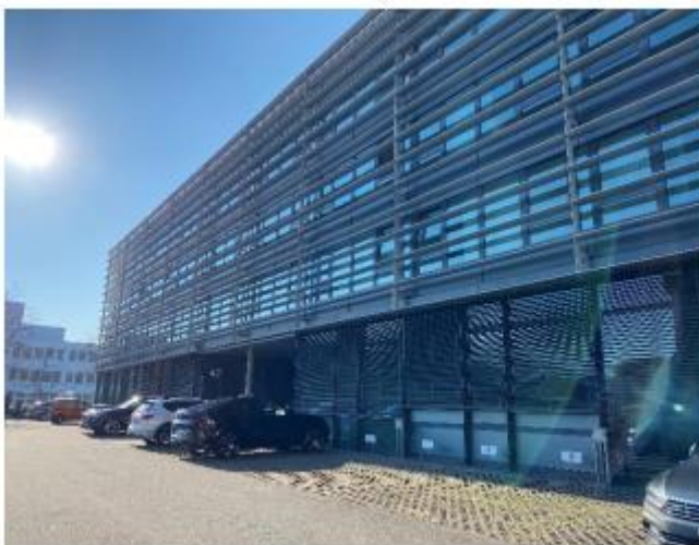
Eingang Gebäude RUEPP & Partner AG / Holdener Treuhand AG

Bitte treten Sie durch die Schiebeglastür auf der linken Seite ein und nehmen Sie den Lift auf der rechten Seite oder die Treppe links bis zum 2. Stock und läuten Sie neben unserer Tür.