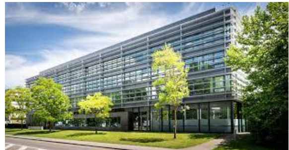
Gebäude RUEPP & Partner AG / Holdener Treuhand AG von der Hauptstrasse

Zu Fuss benötigen Sie für den Weg vom Bahnhof Rotkreuz zu unserer Geschäftsstelle (rund 850m) ca. 12 Minuten. Sie gehen vom Bahnhof Rotkreuz der Birkenstrasse entlang bis zur Odermatt transline AG auf der linken Seite, biegen Sie da ab und folgend Sie der Strasse ca. 100m bis eine Strasse links abföhrt und biegen Sie dann wieder links ab. Nun sehen Sie auf der rechten Seite unser Bürogebäude. Der Eingang befindet sich ca. in der Mitte des Gebäudes.